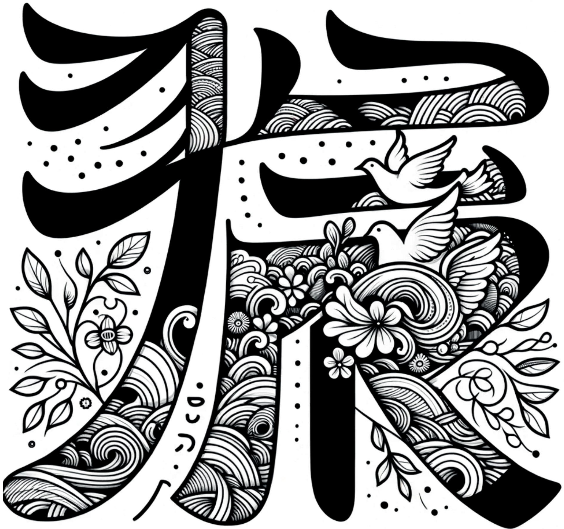
平和 (Heiwa) - Peace